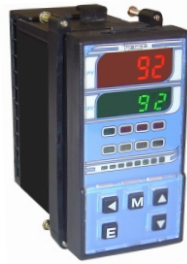
TH 92MS 48 x 96 x 80 mm