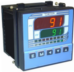
TH 91MS 96 x 96 x 80 mm