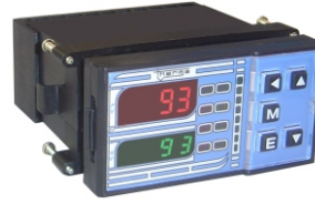
TH 93MS 96 x 48 x 80 mm

APRESENTAÇÃO: os controladores série MS são desenvolvidos com tecnologia e qualidade para proporcionar versatilidade e precisão no controle de processos industriais (temperatura, pressão, etc.) que utilizam servo-motores e servo-válvulas.